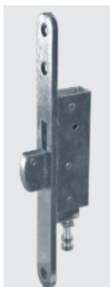
Coffre haut et bas